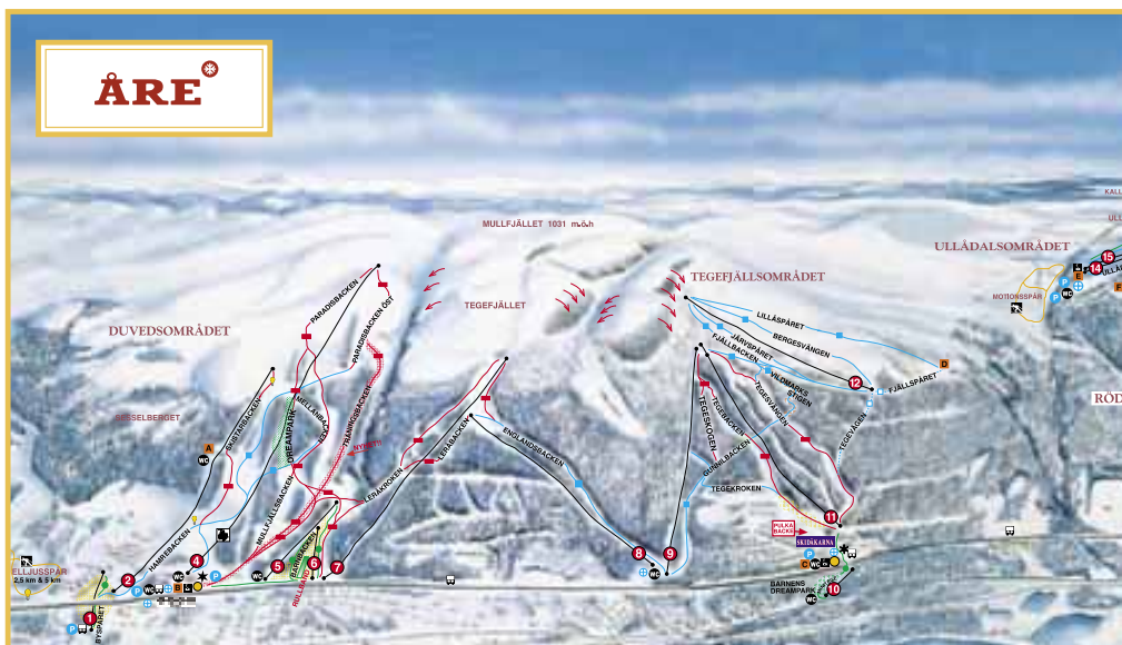
Duveds, Tegefjälls, Åres och Björnens skidsystem.

Det finns möjlighet att få slutstädning, som bokas och betalas i Tegetornets reception.